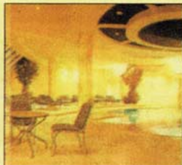
Hotel Gardena/Grödnerhof: a sinistra, un salotto; a destra, la spa

nordic walking sulla neve e delle camminate in quota; il tutto con partenza direttamente dall'hotel.